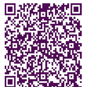
Fig. 3 - Scannerizza il QR code per ascoltare la guida audio con la storia completa.